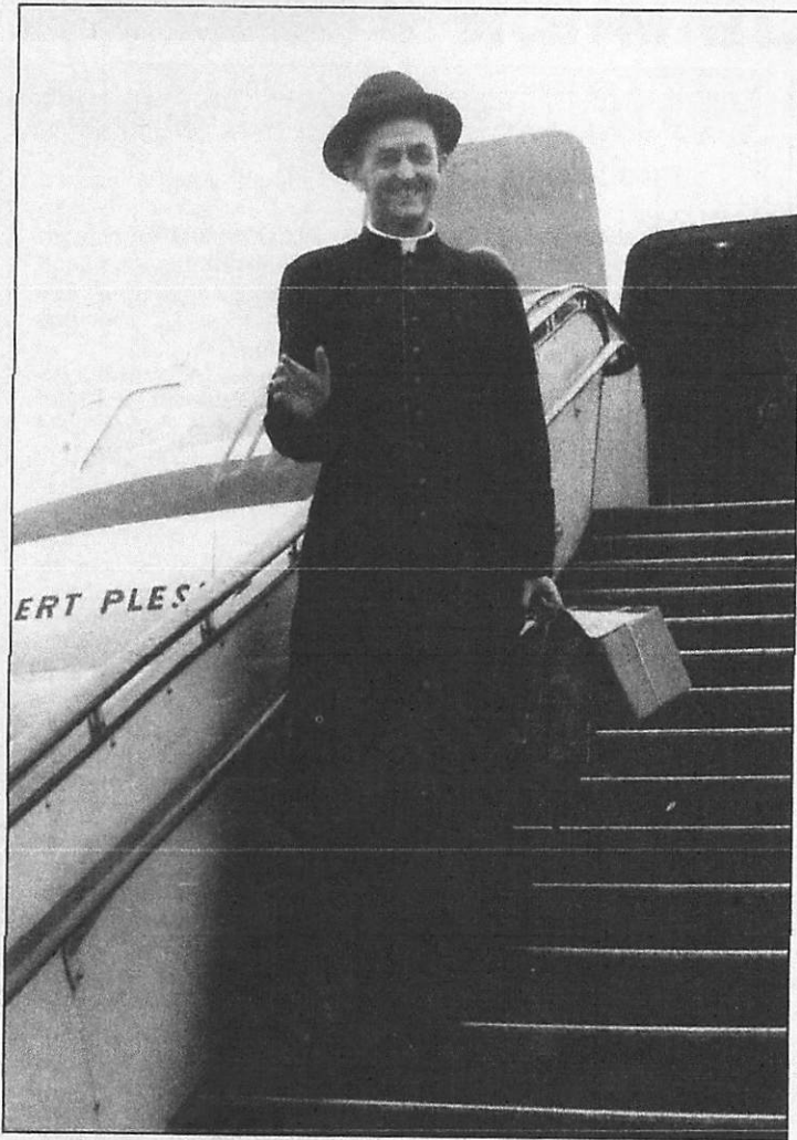
Bisschop Sol in Nederland, 1965

In 1946 vertrok hij naar Indonesië. Drie jaar was hij missionaris op de Molukken. Daarna reisde hij jarenlang door Indonesië als overste van de 'missionarissen van het heilig Hart'. In 1964 werd hij bisschop van de Molukken. Sinds twee jaar is hij met emeritaat. Monseigneur André Sol.